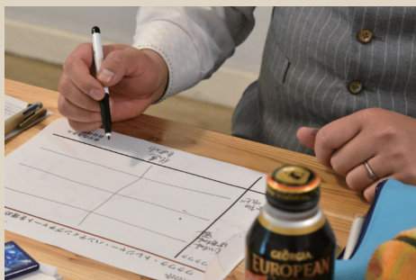
ワクワクトレジャーハンティングチャート