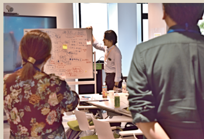
チームビルディング（自分史シェア）