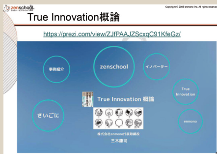
トゥルー・イノベーション概論講義