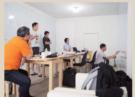
事業ストーリー対話