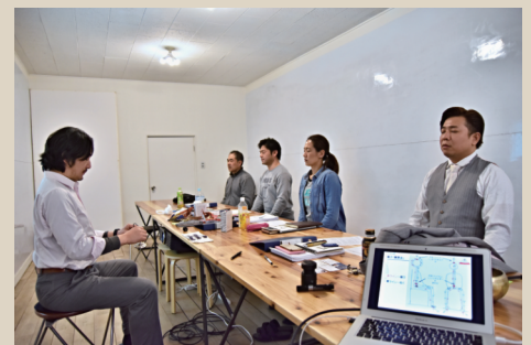
マインドフル瞑想