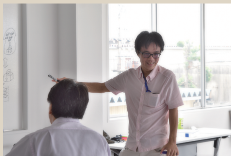
ワクワクトレジャーハンティングチャート対話