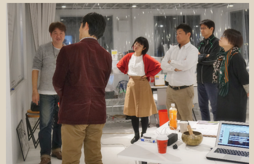
事業ストーリー対話