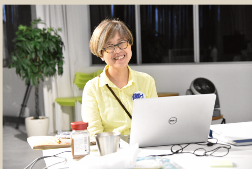
ワクワクトレジャーハンティングチャート