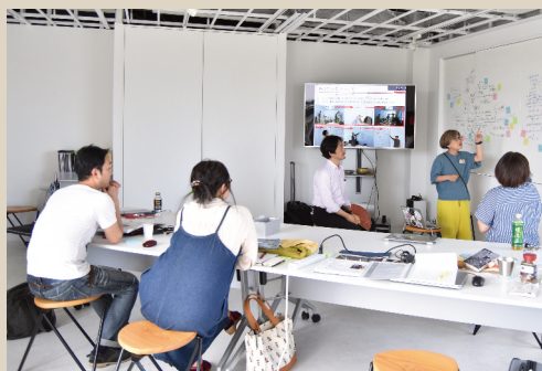
チームビルディング(自分史シェア)