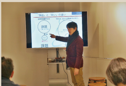
トゥルー・イノベーション概論講義