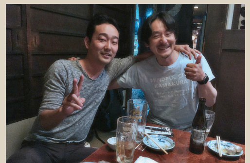
チームビルディング(夕食)